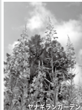
ヤナギランガーデン

■問い合わせ 野沢温泉スキー場 ☎ 85-3166 http://www.nozawaski.com/