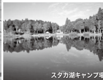
スタカ湖キャンプ場