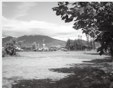
特別養護老人ホーム整備予定地となっている旧中野平中学校跡地

予定地：中野市大字片塩字松崎58番3 （旧中野平中学校跡地） 施設内容：特別養護老人ホーム 90床 短期入所 10床 整備年度：平成23年～平成24年