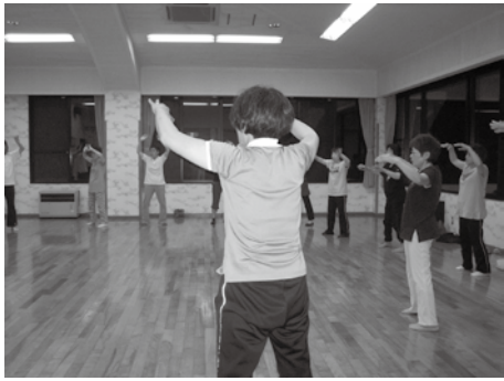
▷熱心に学ぶ受講生

私たちの活動は、今年の五月にスタートしたばかりで、現在は月に二回(第二・第四水曜日)に行っています。興味のある方は、私たちと一緒に健康な体づくりを、目指しませんか。是非参加をお待ちしています。