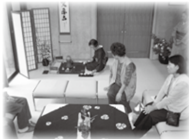
未来利用団体による煎茶のおもてなしサーブスは和服でお出迎えます。

10月1日(土)、2日(日)の2日間、「総合学習センターフェスティバル女性センター未来文化祭」を開催します。皆様のご来館をお待ちしております。