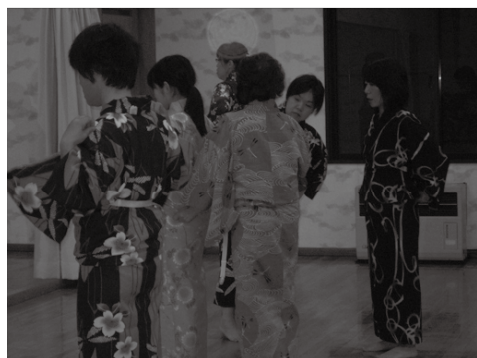
▷鏡を見ながら基本を学ぶ受講生たち