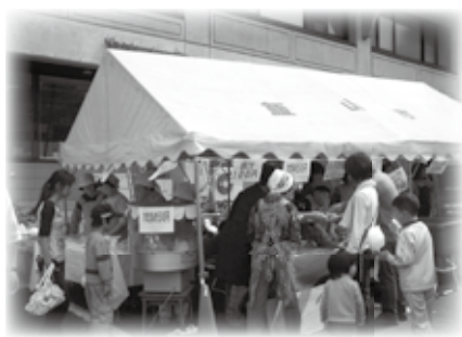
▷来館者との交流が楽しい販売ボランティア

この文化祭を支えていただける当日の販売ボランティアを募集しています。お問い合わせは女性センター未来(☎62-0543)までお願いします。