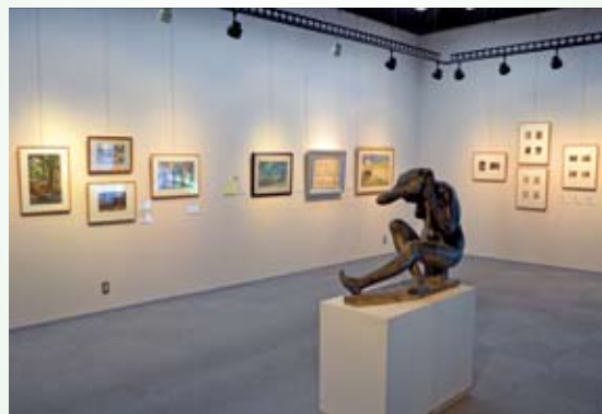
ギャラリー展示の様子。材料や技法にご注目。

漆画・絹画・版画・油彩画・日本画・水彩画・木彫など多彩な展示内容。さまざまな材料・技法により生み出された作家たち独自の造形表現をご鑑賞ください。