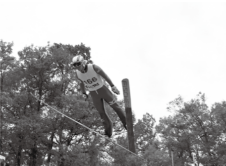
昨年の大会の様子(一般・メディアムヒル)

■お問い合わせ 飯山市教育委員会事務局内 サマーキャンプ大会事務局 ☎ 3311 (内線353)