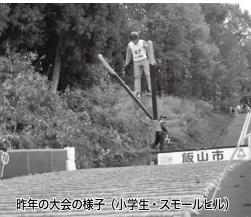
昨年の大会の様子(小学生・スモールヒル)