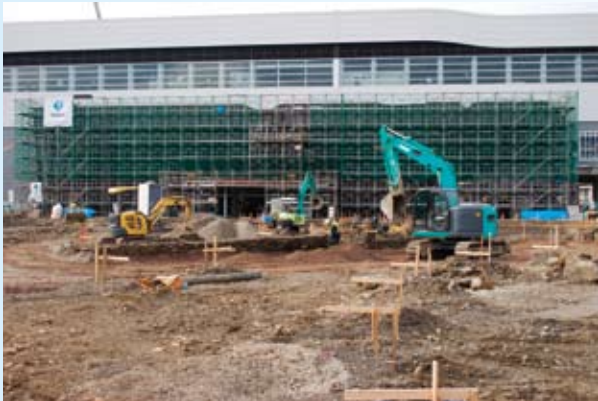
△ロータリー部分の掘削工事を中心に進められています。(H25.11.25 現在)

平成27年春の北陸新幹線飯山駅開業に向けて、ようやく千曲川口広場の整備工事が始まりました。交通と広域観光のハブ機能を担う、交通結節拠点としてふさわしい整備を進めていきます。