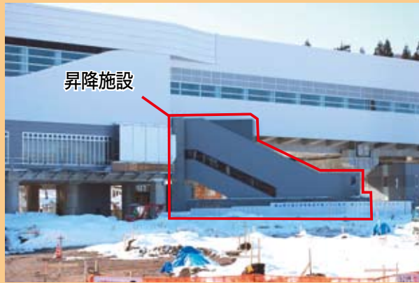
昇降施設外観（平成26年1月撮影）