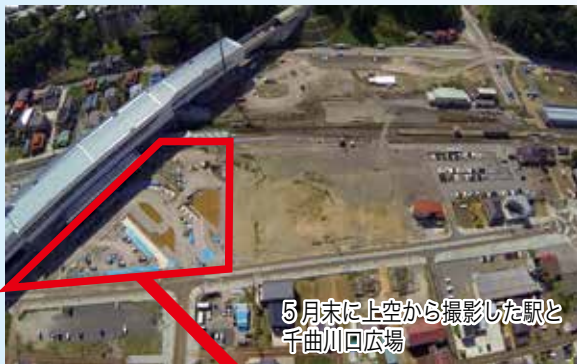
5月末に上空から撮影した駅と千曲川口広場

下の写真にあるように、現在はロータリー部分の工事を中心に進めています。完成、新幹線開通後は多くのお客様を信越自然郷へ送り出す玄関口となります。