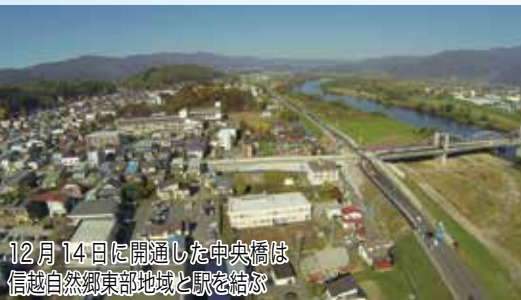
12月14日に開通した中央橋は 信越自然郷東部地域と駅を結ぶ

12月中旬から開業日前日の 3月13日まで通常の運行時間 を想定した新幹線の試験走行が行われます。