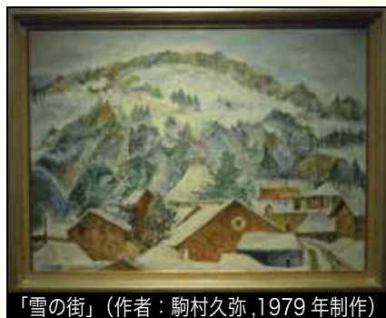
「雪の街」(作者：駒村久弥, 1979年制作)

それぞれの美術家 たちの眼を通して写しだ された飯山の魅力を味わ っていただく…。そんな おもてなしで市内外から のお客さまをお迎えした いと思います。