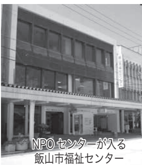
NPOセンターが入る飯山市福祉センター

登録、会費は無料です。登録は、申込書に必要事項をご記入のうえ、郵送またはメールにてNPOセンター宛に送付してください。申込書はいいやまNPOセンター、またはホームページからもダウンロードできます。興味のある方は、ぜひお問合せください。