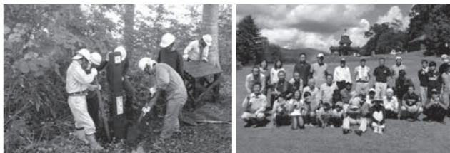
信越トレイルクラブの活動

【お知らせ】 NPOだよりでは、市内で活動するNPOや市民活動団体の活動紹介を掲載して下さる団体を募集しています。お気軽にお問い合わせください。(☎ 62-7030)