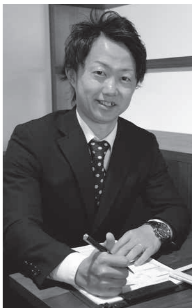
身近な町の保険屋さん