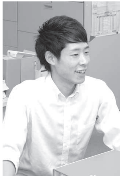
気持ちの切替スイッチを