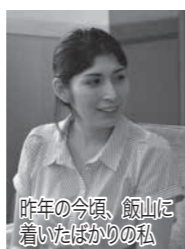
昨年の今頃、飯山に着いたばかりの私

みなさんこんにちは! ちょうど一年ほど前、私が飯山に着いた日は、とても緑がまぶしく、うだるような暑さの日でした。