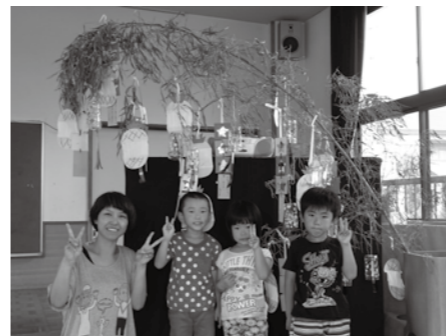
工夫して作った七夕飾り

また、8月7日には、月遅れの七夕をしました。七夕に使う笹竹は地域の方が保育園の子どもたちのためにと毎年ご厚意でくださいます。今年は七夕飾りを作る時、春にいただいたプラスティックの容器で七夕の飾りを各年齢で工夫して一人ひとりで作りました。みんなで笹に飾ると風に揺れてきれいでした。