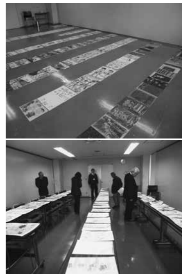
情報委員会での審査風景

飯山市農業委員会事務局 飯山市役所農林課内 電話：0269-62-3111 (内線261) FAX：0269-62-6221