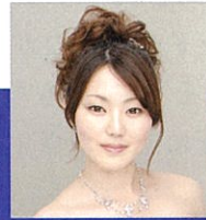
ヴィオレッタ 高品綾野