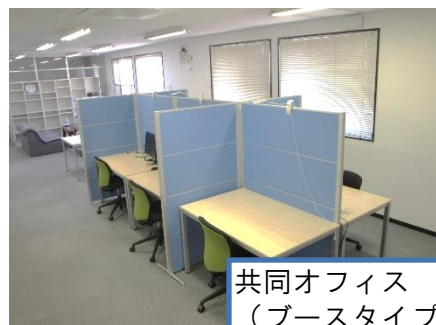
共同オフィス (ブースタイプ)