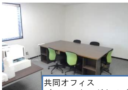
共同オフィス (コワーキングタイプ)