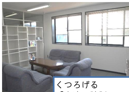
くつろげる 「交流・談話スペース」