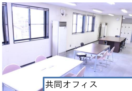
共同オフィス (コワーキングタイプ)