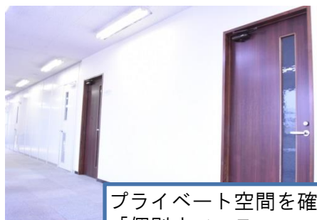
プライベート空間を確保 「個別オフィス」