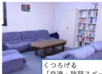
くつろげる 「交流・談話スペース」