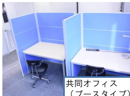
共同オフィス (ブースタイプ)